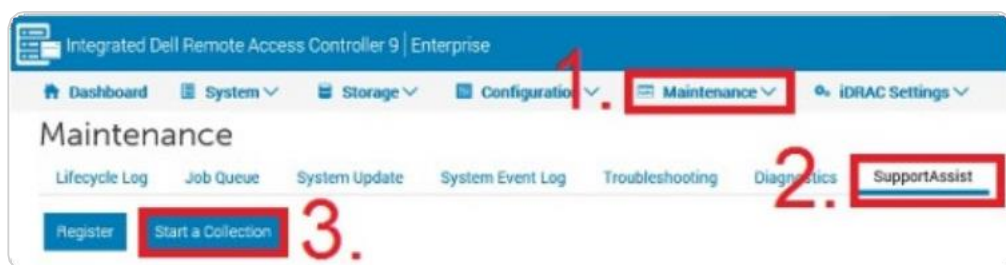
Рис. 1 Меню «iDRAC9 SupportAssist Collection»